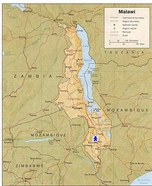
Kaart van Malawi met aanduiding van de locatie van 'Glory to God Youth and Orphan Care'.