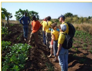
Groenteteelt op de boerderij

Hierna schrijft een kind uit het dagopvangcentrum zijn ervaringen.