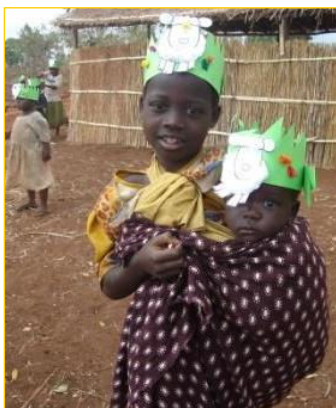
Impressies bouwreis 2007 Boven: bezoek aan gezin Onder: kinderen tijdens het kinderwerk