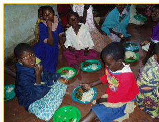
Maaltijd in het dagopvangcentrum van 'Glory'

Verder zal in deze nieuwsbrief een nieuw